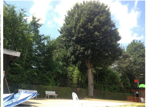
Acer pseudoplatanus 'Purpurascens',