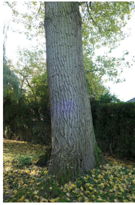
Canadese populier, Jean Monnetpark